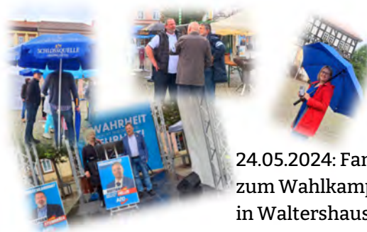
24.05.2024: Familienfest zum Wahlkampfabschluss in Waltershausen