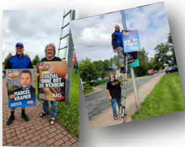
25.07.2024: Nun ist es an der Zeit, das Straßenbild wieder blau zu färben! Gestern haben wir unter anderem in Ohrdruf im Stadt- und Gewerbegebiet plakatiert und konnten dabei vielen freundlich grüßenden Autofahrern zurückwinken.