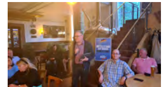
24.05.2024: Bürgerabend in Arnstadt