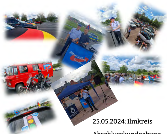
25.05.2024: Ilmkreis Abschlusskundgebung mit Autokorso zum Wahlkampffinale