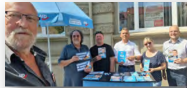
31.07.2024: Infostand in Ohrdruf